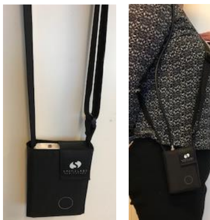
Figur 3. bæretaske med stropper.

OnTrak opbevares i den medfølgende bæretaske og fastgøres enten til patientens eget bælte (stropperne på bæretasken fjernes) eller OnTrak bæres som en skuldertaske se figur 3.