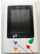
Figur 4. OnTrak

Kontroller at OnTrak virker korrekt, ved manuelt at foretage 4 blodtryksmålinger