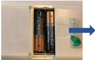
Figur 1. Batterirum på OnTrak

På bagsiden af onTrak finder du batterirummet. Tag dækpladen af batterirummet, sørg for at batterierne vender rigtigt, du kan se på batterirummets inderside, hvordan batterierne skal vende se figur 1.